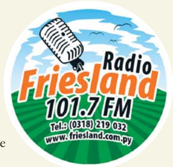
Logo von Radio Friesland

Seit Dezember 2006 gibt es in Friesland einen kleinen, lokalen Radiosender. Diese Initiative entstand aus dem Mangel und der Notwendigkeit einer guten und schnellen Kommunikation. Lokale, nationale und internationale Nachrichten können so schnell unter die Bürger gebracht werden. Neben diesem Informationsdienst bietet der Sender verschiedene Programme und eine große Auswahl an Musik.