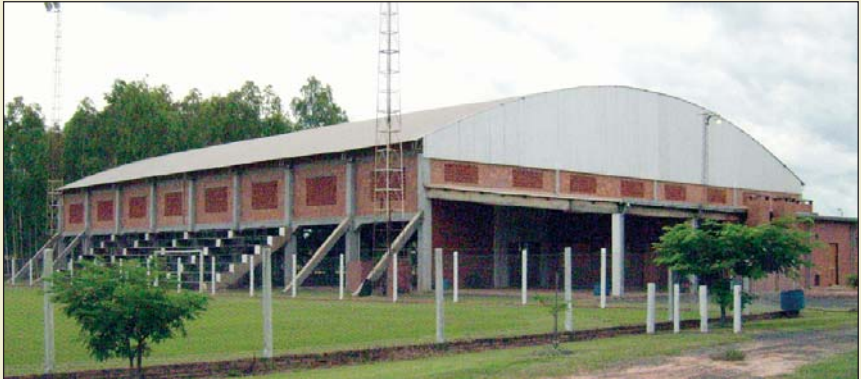
Sporthalle des Deportivo Estrella

Der Sportverein besitzt ein gut beleuchtetes Fußballfeld, ein Volleyball- und Hallenfußballfeld unter einem großen Dach, eine gut eingerichtete und ausgestattete Küche und einen Saal für kulturelle Veranstaltungen. Alle kolonialen und interkolonialen sportlichen Ereignisse finden auf diesem Platz statt. Auch Schölerabende, Musikprogramme, Sketsch- und Theaterabende, Hochzeitsfeste, Erntedankfeste, Sitzungen und Fortbildungen werden auf dem Hof des Sportvereins durchgeführt.