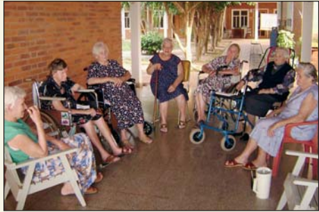
Senioren der Kolonie

Im Jahre 2007 läuft ein Projekt einer effektiven und günstigen Rentenversicherung an. Das Ziel dieser Rentenkasse ist es, den Bürgern einen sicheren Lebensabend zu bieten.