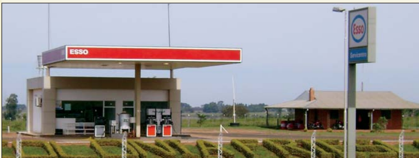
ESSO – Tankstelle auf der Fernstraße 10