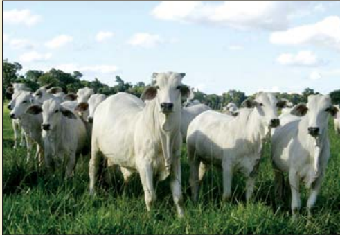
Vieh von der Rinderfarm der Kooperative

Die Viehfarm der Kooperative Friesland ist eine Abteilung, die jährlich einen relativ guten Gewinn bringt und als finanzielle Reserve wirkt. Unter anderem wird auch das Vieh der Bürger aufgekauft, um es dann nach Möglichkeit und Notwendigkeit weiter zu verkaufen. Die Viehfarm liefert auch das Fleisch für die Fleischverkaufsabteilung der Kooperative. Es werden wöchentlich ca. 12 Rinder geschlachtet.