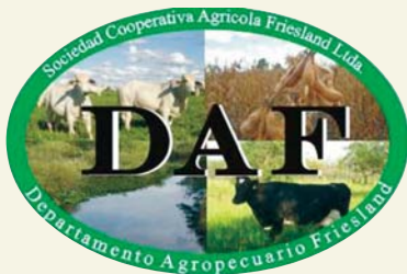
Logo von DAF

nachhaltige Agrarproduktion zu fördern, die Diversifizierung anzustreben, das Umweltbewusstsein zu fördern und höhere Einnahmen zu erzeugen. Zu diesem Service zählt nicht nur das ständige Angebot verschiedener Fortbildungen im Agrarbereich, sondern auch professionelle Beratung im Bereich der Viehzucht und der Milchwirtschaft.