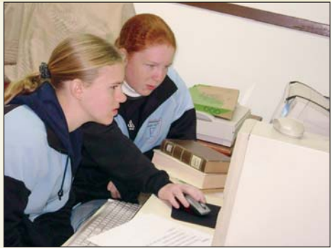
Schüler im Informatikunterricht

fühlten die Lehrer sich überfordert, wenn sie alle sechs Klassen in einem Raum unterrichten mussten, was meistens der Fall war. Nach vielen Diskussionen zwischen Eltern und Verwaltung/Lehrerschaft, die das Für und Wider einer zentralisierten Schule besprachen, kam die Vollversammlung zu dem Entschluss, das Schulsystem erneut zu zentralisieren. 1974 lief dieses Projekt an. Man sprach damals von der "Mittelpunktschule". Beim Bau des neuen Schulgebäudes bekamen sie sowohl finanzielle wie auch materielle Unterstützung von der ZfA in Köln in der Bundesrepublik Deutschland.