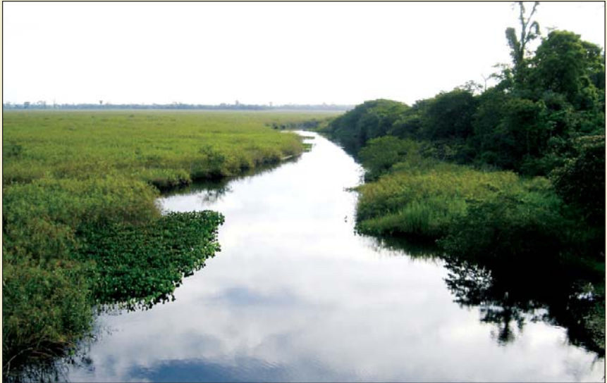
Tapiracuaifluss in Friesland