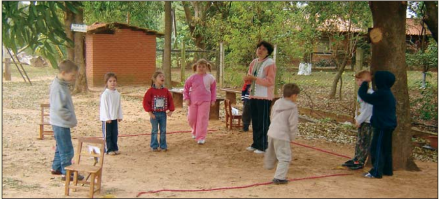
Kinder beim Spiel in der Schule

In den Anfangsjahren schlossen sich die Neusiedler der Kolonie Friesland zu zwei großen Schulgemeinden zusammen. Ziel dabei war, das Schulwesen auf zwei Ortschaften zu zentralisieren, um dadurch die Unterhaltungskosten zu senken. Mit dem Bau dieser beiden Schulen (in Zentral und Großweide) wurde schon bald begonnen, und im April 1938 begann der Unterricht. Die Kinder erhielten einen geregelten Unterricht in der Muttersprache und eine geordnete christliche Erziehung. Die Schulpflicht wurde auf sechs Jahre festgesetzt und dem paraguayischen Schulsystem angepasst.