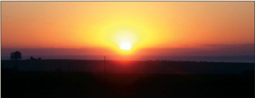
Sonnenuntergang in Friesland

Für Tourismus und Freizeitgestaltung findet man in der Kolonie Friesland verschiedene Plätze. Einmal der Lomas Park, in dem Freizeiten, Familien- und Geburtstagsfeste und sonstige Veranstaltungen gefeiert werden. Eine schöne Umgebung, genug Schatten und ein Aufenthaltsraum bieten eine angenehme Atmosphäre. Im Sommer und besonders an den Wochenenden ist der Tapiracuai-Fluss ein beliebter und oft besuchter Ort. Hier findet man Gelegenheit zum Baden, zum Volleyball spielen, zum Grillen oder auch einfach nur Spaziergänge durch eine wunderschöne Natur zu machen. Auf privater Ebene wird auch einiges geboten. Das Hotel Tannenhof bietet Besuchern und auch Einheimischen in einer schönen Umgebung Platz für Unterkunft und Verpflegung.