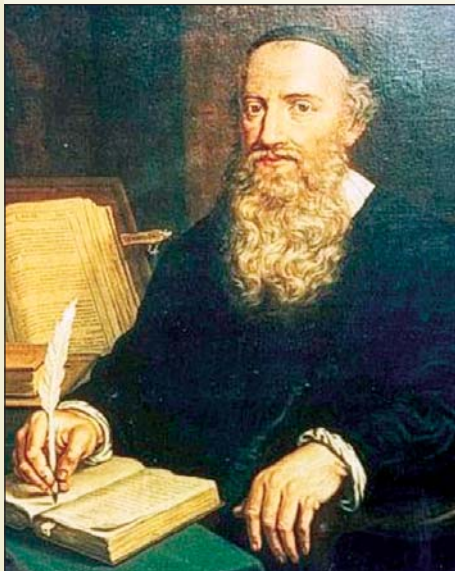
Menno Simons (1496-1561)

Diese Prinzipien, die in entschiedener Form ausgelebt wurden, verursachten eine Verfolgung der Wiedertäufer von Seiten der Regierung sowie auch der Kirche. Auf diese Weise verstreuten sich die Wiedertäufer auf weite Teile Europas. Der niederländische katholische Ex - Priester Menno Simons sammelte und festigte viele dieser Täufer, die bald darauf "Mennoniten" genannt wurden. Die Mennoniten haben sich von Anfang an durch ihre Tüchtigkeit auf dem landwirtschaftlichen Gebiet hervorgetan. Auf den Wanderwegen durch Nordeuropa, Russland, die Vereinigten