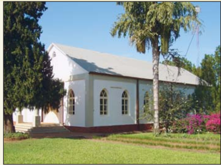
Gebäude der Mennoniten Gemeinde

Am ersten und dritten Sonntag im Monat versammeln sich die Gemeinden in separater Form. An den übrigen Sonntagen finden die Gottesdienste in den jeweiligen Bezirken (Zusammenschluss von mehreren Dörfern) statt. Der Gottesdienst besteht normalerweise aus Gemeindegesang, einer Predigt, Lieder von einem Chor oder einer Gruppe und Zeugnissen.