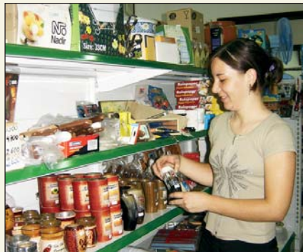
Supermarkt der Kooperative

Diese Abteilung ist verantwortlich für das Anbieten verschiedener Konsumartikel. Im Supermarkt und in der Lebensmittelabteilung findet der Kunde ein großes, preisgünstiges Angebot an Verkaufsartikeln. Die Leitung der Abteilung bemüht sich um die Beschaffung derselben.