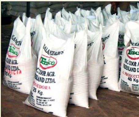
Produkte der Mischfutterfabrik

1992 installierte die Kooperative eine kleine Mischfutterfabrik. Auf Grund der hervorragenden Qualität der Produktion, sowie einer guten Vermarktung, vergrößerte sich dieser Produktionszweig rapide. Hergestellt wird Mischfutter für Kühe, Schweine, Geflügel und Pferde. Monatlich sind es etwa 320.000 kg Mischfutter. Hinzu kommt auch die Herstellung von Mineralsalz. Durch diesen Industriezweig haben die Bauern die Möglichkeit, Futter