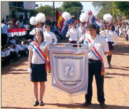
Alumnos del Colegio Friesland en un desfile

Con esta descentralización se creyó haber solucionado el problema. Pero pronto se enfrentaban con otras dificultades como: la disminución de alumnos por causa de la emigración de los habitantes, por este motivo no se podía habilitar el primer grado cada año. Además los profesores se sentían sobrecargados con los seis grados en una misma aula, como se daba en la mayoría de los casos. Analizando los aspectos negativos y positivos de esta situación, en la asamblea general se decidió centralizar la educación nuevamente. En 1974 empezó este proyecto. Para la construcción del edificio recibieron ayuda de la ZfA de Alemania.