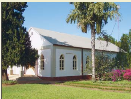
Edificio de la Iglesia MG

Por las distancias geográficas se suele hacer también los cultos dominicales en las diferentes aldeas. Varias aldeas cuentan con una pequeña iglesia. El culto dominical consiste en: cantos, prédica, trabajos grupales para tratar temas de la Biblia, charlas, intercambio de ideas, etc.