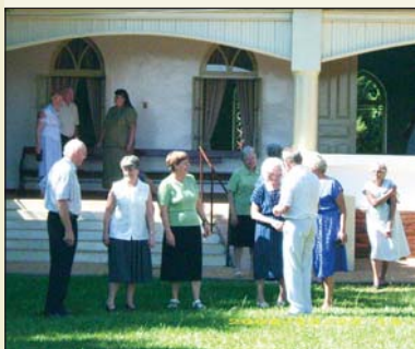
Pobladores de la colonia van al culto dominical

Las Iglesias tienen una importancia fundamental dentro de la comunidad. Las funciones de la Iglesia y de la Asociación Civil no siempre se pueden separar visiblemente. El objetivo principal de la Iglesia es conocer y divulgar la palabra de Dios. La evangelización es una tarea primordial de cada cristiano. La iglesia se encarga de los cultos, la enseñanza dominical para niños y jóvenes, cursos, asociación de mujeres y otras tareas afines.