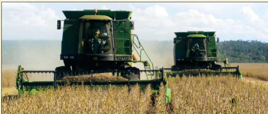
Cosecha de Soja