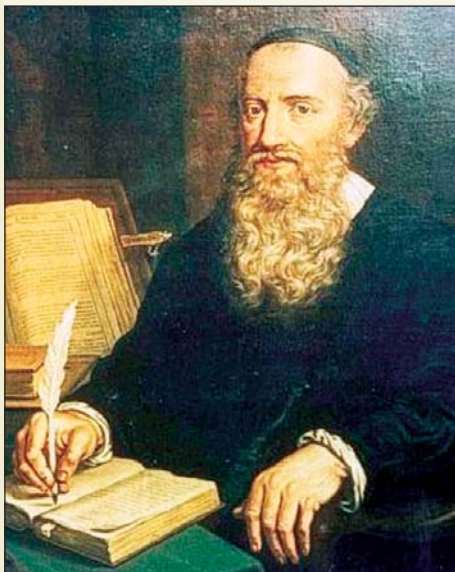
Menno Simons (1496-1561)

Estos principios, vividos y practicados en sus diferentes formas por los anabautistas, causaban persecución por parte del gobierno y de la iglesia. De esa forma los anabautistas se esparcieron por casi toda Europa. En la región de los países bajos, el ex-sacerdote católico Menno Simons, convencido de los ideales protestantes y anabautistas reunió y organizó a estas "ovejas dispersas", además formó una congregación religiosa, a la cual más tarde le fue impuesto por sus enemigos el nombre de "Mennonitas" (de Menno Simons).