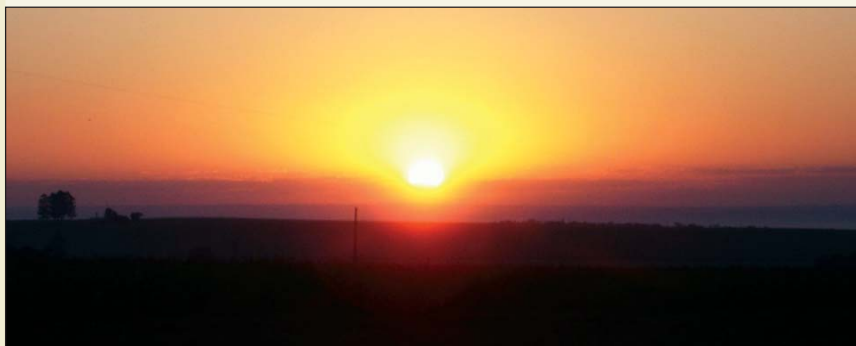
Atardecer en Friesland

El Hotel Tannenhof es otro lugar en el centro de la Colonia que ofrece por iniciativa propia turismo interno, alojamiento y servicio de restaurante a todos los visitantes.