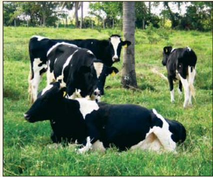
Vacas lecheras (Holanda)

tenía que estabilizar la situación económica de los pequeños agricultores. Pero por la pequeña cantidad de leche producida y la enorme competencia en el mercado local y nacional, no se logró una estabilidad definitiva. En 1998 comenzó una cooperación con la lechería del Chaco central "Trébol" y con esto se obtuvo una mejor rentabilidad de la industrialización de la leche. Actualmente son procesados 1.300.000 litros de leche al año.