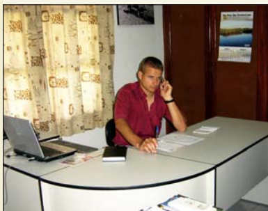
Oficina de Comercialización

A través de la cooperativa se ofrece la ayuda en el área de la comercialización en los diferentes rubros: granos (soja, maíz, girasol, trigo, kafir), ganado (venta de ganado vivo al matadero de Neuland y el comercio interno de ganado entre los ganaderos) y leche.