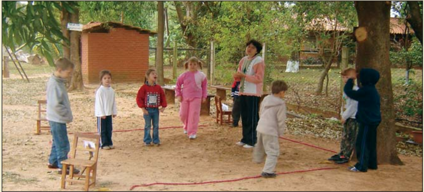
Niños jugando en la escuela

niños recibían la educación en su lengua materna con énfasis en valores cristianos. La educación fue adaptada al sistema nacional y la escolaridad era de seis años.