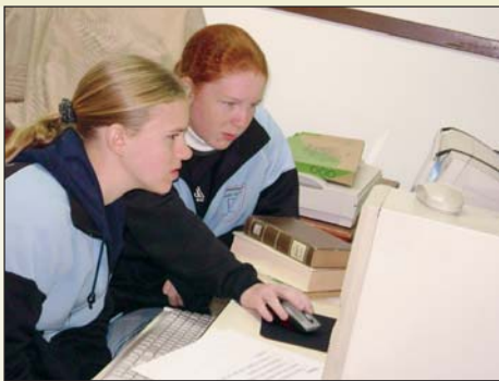
Alumnas en la clase de Informática

estudio para la secundaria a través de la Resolución N° 62. La escuela (1° - 6° Grado) fue reconocida en 1975 por el Ministerio de Educación y Cultura del Paraguay. Dos años más tarde se aprobó el 3er. Ciclo de la Educación Escolar Básica. En 1992 fue reconocido el 1° Curso Bachillerato. En el año 2001 por primera vez se abrió el 2° Curso y un año más tarde en 2002 se habilitó el 3° Curso y por fin los jóvenes pueden culminar sus estudios en su colonia-patria.